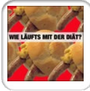
GewichtGucker - keine Diät sonde... 260 Mitglieder